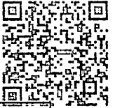
附录A 服务范围及工作内容、酬金一览表