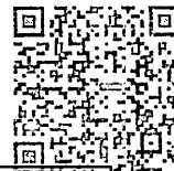
附录B 咨询人提交成果文件一览表