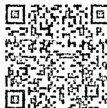
附录C 委托人提供资料一览表