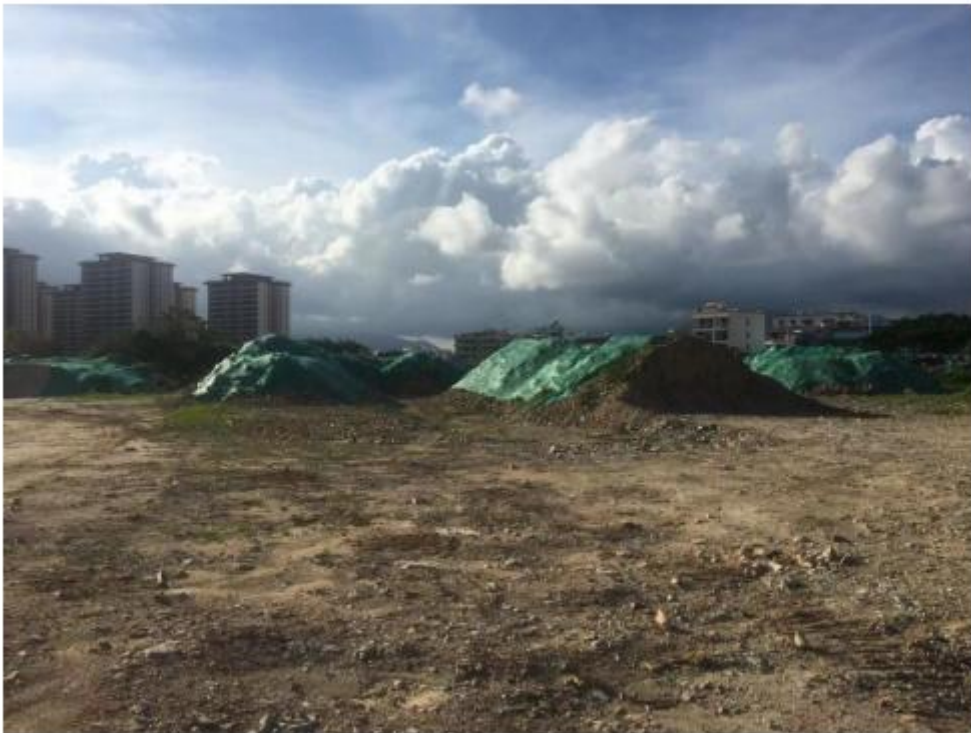
图 2 场地现状图