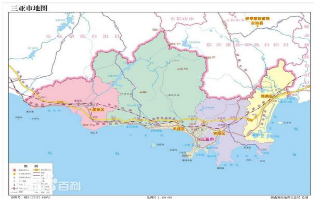
图 1 三亚市天涯区区位图