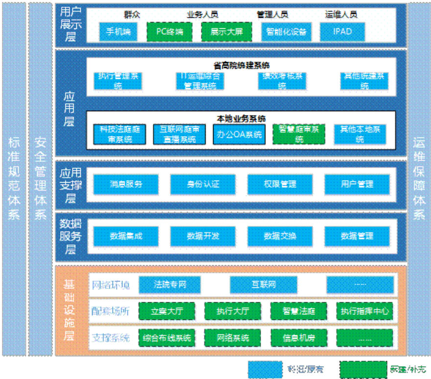
信息化总体架构图

本项目信息化总体架构按照三纵五横设计，其中五横包括基础设施层、数据服务层、应用支撑层、应用层和用户展示层，三纵包括标准规范体系、安全管理体系和运维保障体系。信息化总体架构如下图：