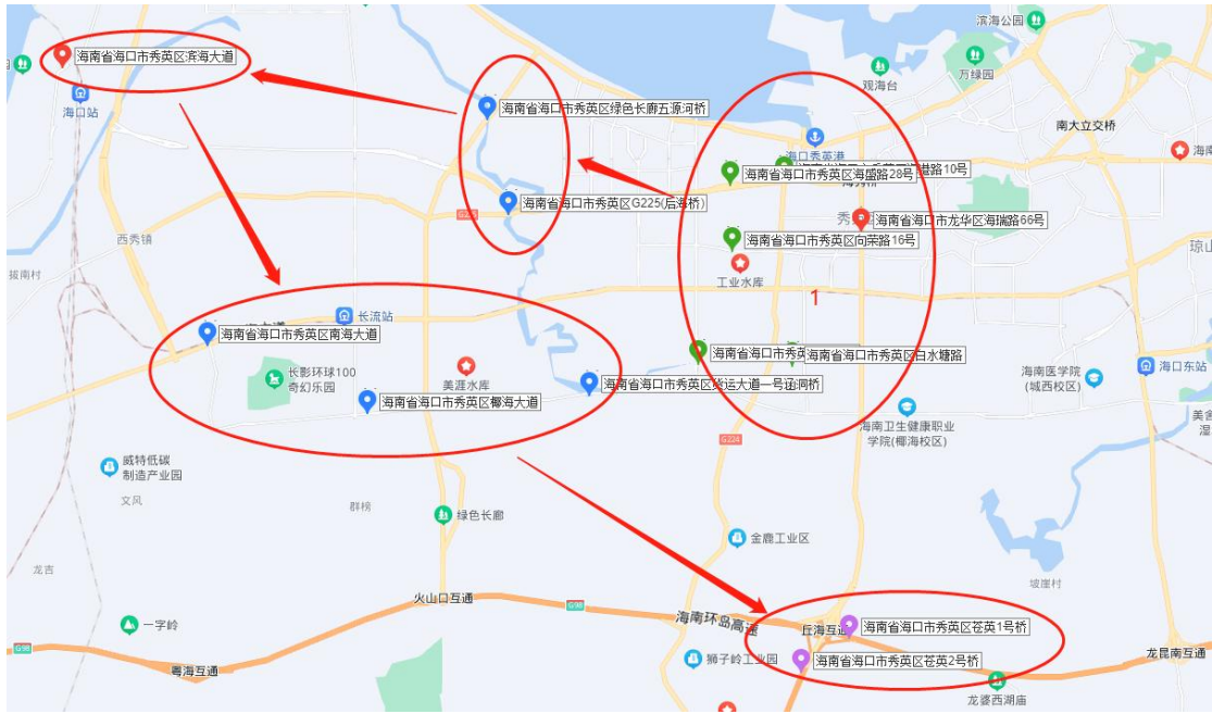
图 3 秀英区桥隧分布图