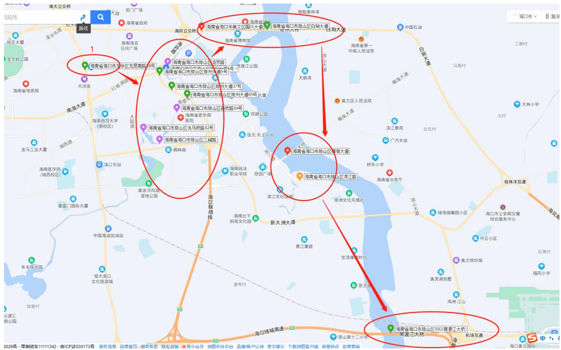
图 4 琼山区桥隧分布图