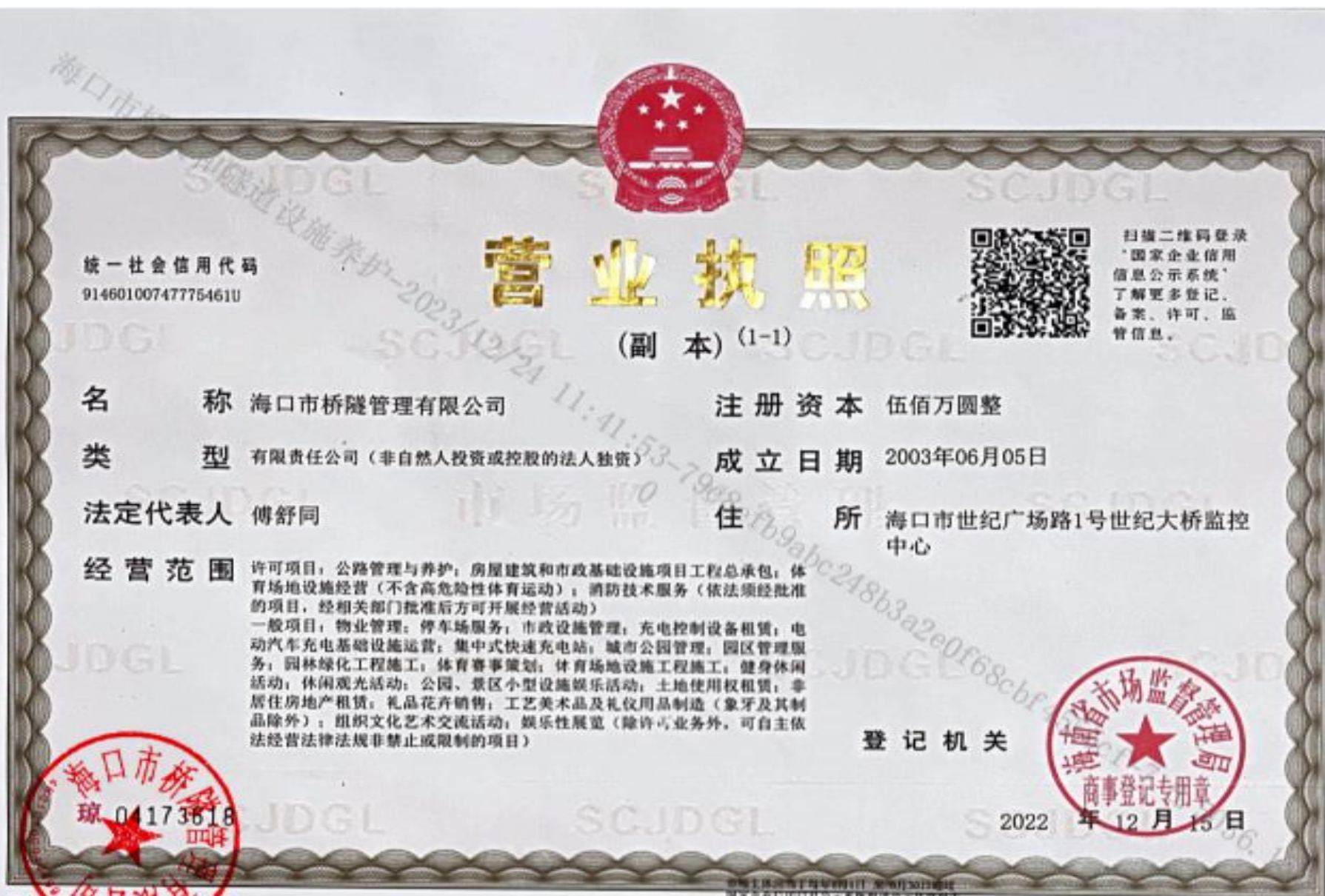
附件 1: 中标人营业执照