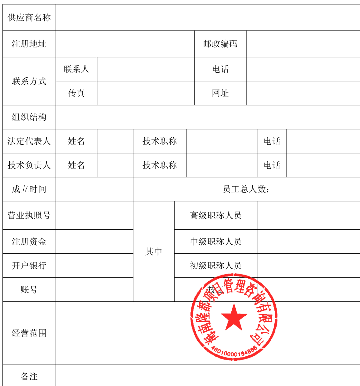
供应商基本情况表